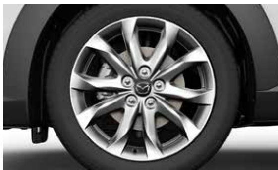
18" lichtmetalen velgen Silver Design 152, 7J x 18. Geadviseerde bandenmaat: 215/50 R18.