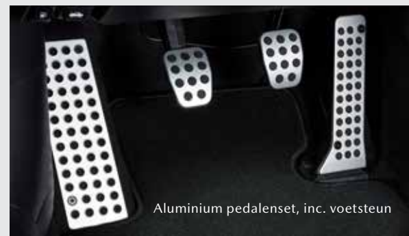
Aluminium pedalenset, incl. voetsteun