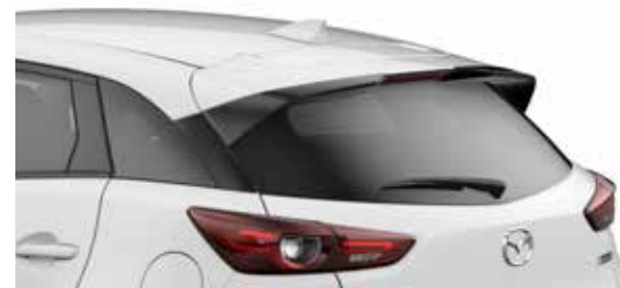
Dakspoiler Uitgevoerd in Brilliant Black.