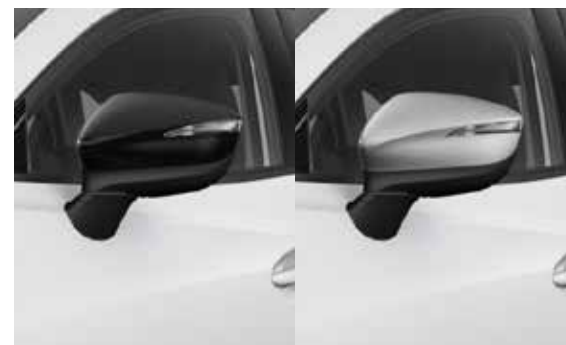
Spiegelkappen Keuze uit Brilliant Black of Bright Silver.