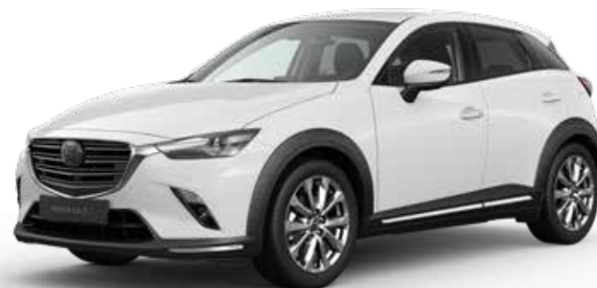
ARTIC WHITE SOLID