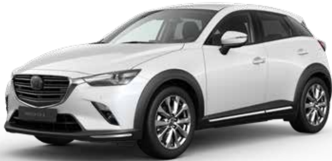
SNOWFLAKE WHITE PEARL*