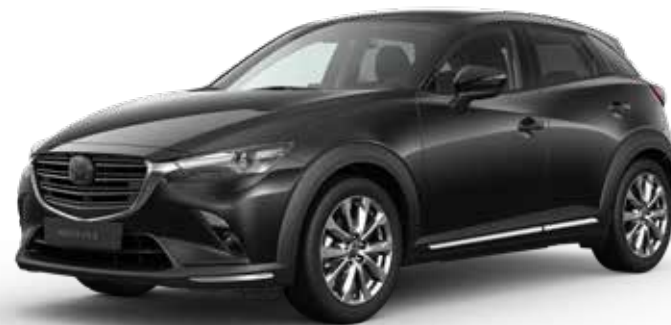
JET BLACK MICA