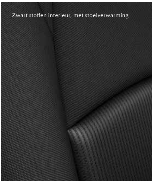
Zwart stoffen interieur, met stoelverwarming