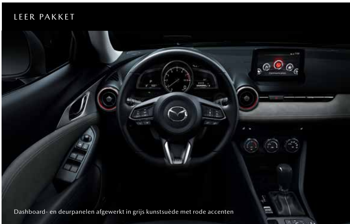
Dashboard- en deurpanelen afgewerkt in grijs kunstsuède met rode accenten