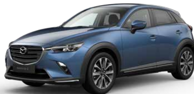
ETERNAL BLUE MICA* / **