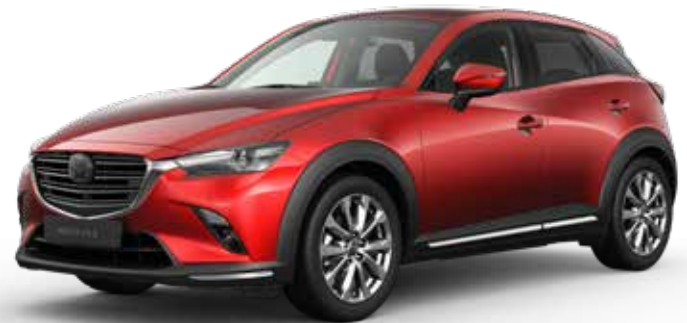
SOUL RED CRYSTAL METALLIC