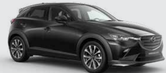
Mazda CX-3 met Sport pakket