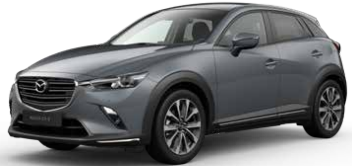
POLYMETAL GRAY METALLIC* / **