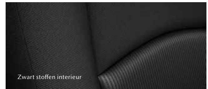
Zwart stoffen interieur