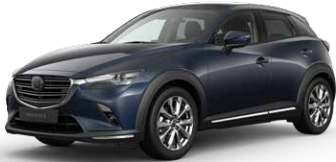
DEEP CRYSTAL BLUE MICA