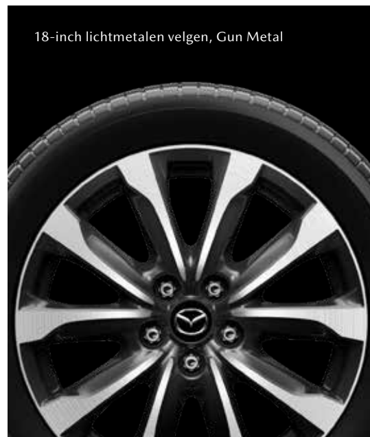
18-inch lichtmetalen velgen, Gun Metal