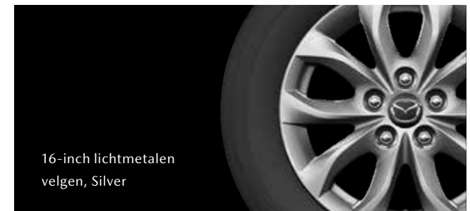
16-inch lichtmetalen velgen, Silver