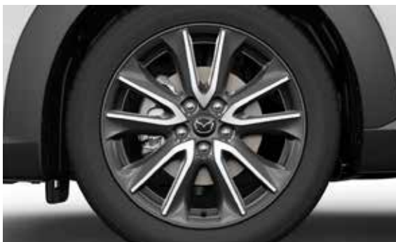
18" lichtmetalen velgen Diamond Cut Design 157, 7J x 18. Geadviseerde bandenmaat: 215/50 R18.