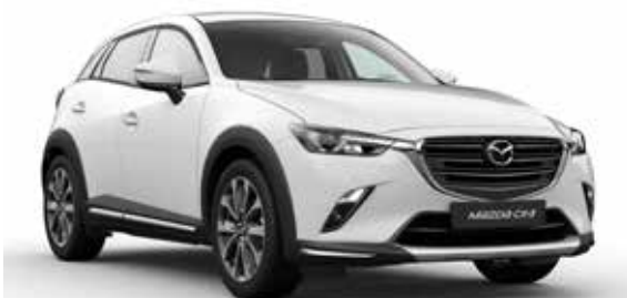
Skidplate t.b.v. voorzijde Uitgevoerd in zilverkleur.