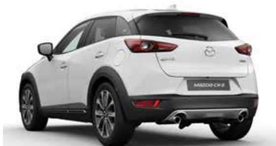
Skidplate t.b.v. achterzijde Uitgevoerd in zilverkleur.