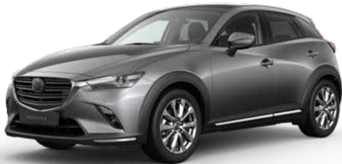
MACHINE GRAY METALLIC